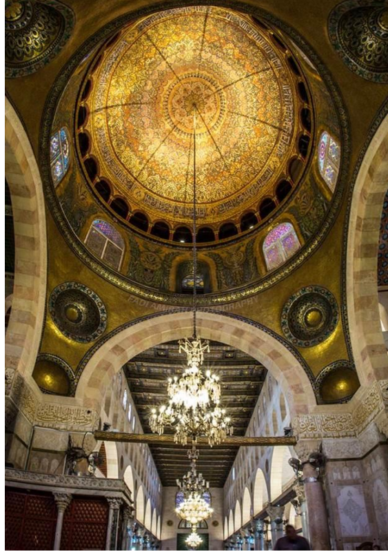
رقبة قبة المسجد القبلي بعد الترميم