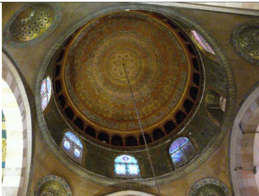
رقبة قبة المسجد القبلي قبل الترميم