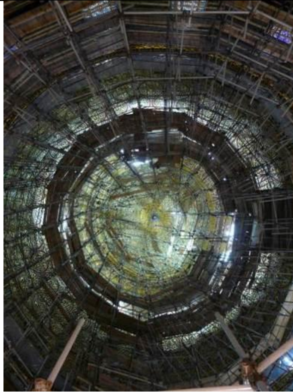
رقبة قبة الصخرة المشرفة قبل الترميم