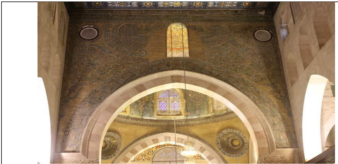
واجهة الرواق الأوسط قبل الترميم

يعد مشروع ترميم الزخارف الفسيفسائية الذي نفذته وزارة الاوقاف والشؤون والمقدسات الاسلامية الاردنية ودائرة اوقاف القدس من المشاريع الريادية لأعمار المسجد الاقصى المبارك , والذي هو احد مشاريع المبادرات الملكية السامية , حيث تم فيه ترميم جميع الزخارف التي تعرضت لتقلبات الزمن كما كانت أيام الدولة الاموية , وهذا المشروع يعد الاول منذ ثمانمئة عام حيث اعيدت الزخارف الفسيفسائية كما كانت في السابق , وقد استمر هذا المشروع اكثر من عشر سنوات وعلى عدة مراحل وفاقت نفقات هذا المشروع عن مليوني دولار وتبلغ اجمالي مساحة الزخارف الفسيفسائية التي تم توثيقها ودراستها وترميمها اكثر 1545 مترا مربعا , وفيما يلي بعض الصور التي تبين هذه الزخارف قبل الترميم وبعده .